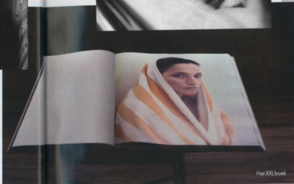
Het XXL boek