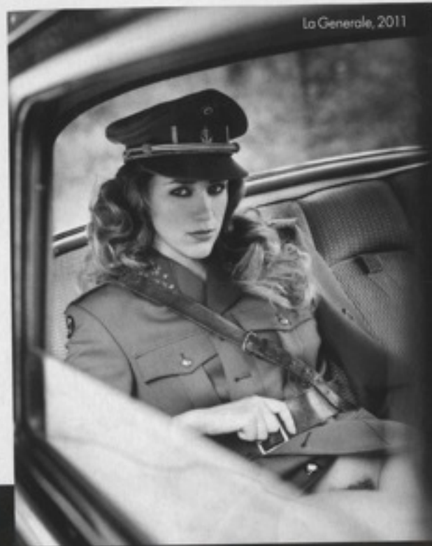
La Generale, 2011