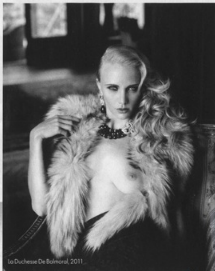
La Duchesse De Balmoral, 2011