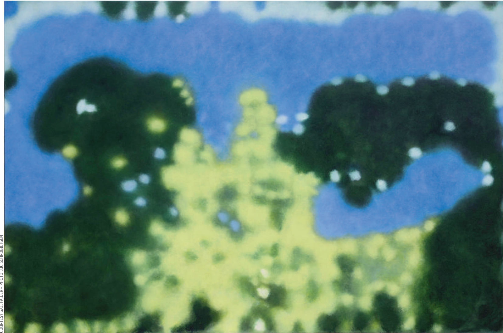
Ci-dessus : Jeff Kowatch, "Blue by you", huile sur toile, 130x195cm. Ci-contre : "Think Tank", huile sur toile, 100x80cm. Sur l'autre page : "Yellow Field", huile sur toile, 80x60cm.