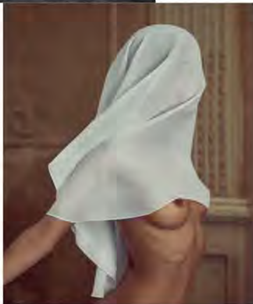
Statue. Marc Lagrange.

Denk nu niet dat het sexy is, zo'n fotosessie. Het is teamwork, zeggen ze, en vooral heel hard zwoegen. Shoots in het buitenland zijn duur en met eigen middelen gefinan-