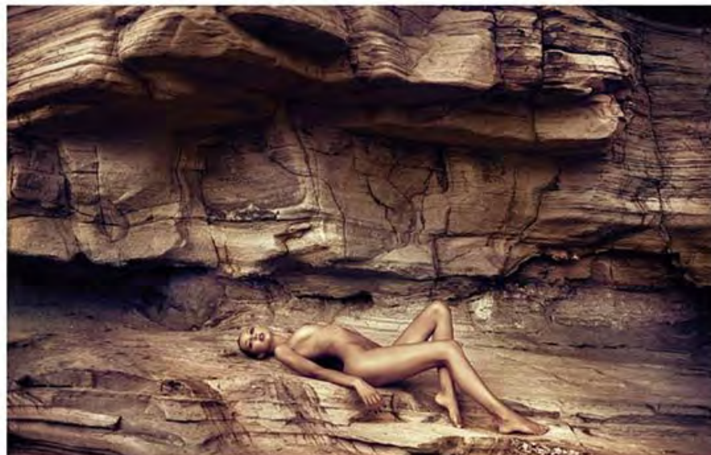
Terra Incognita, Frank De Mulder.