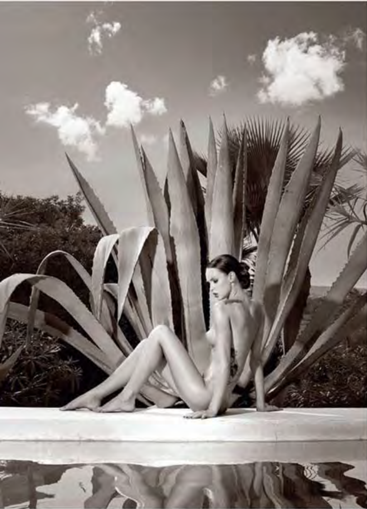
Secret Sadness, Frank De Mulder.