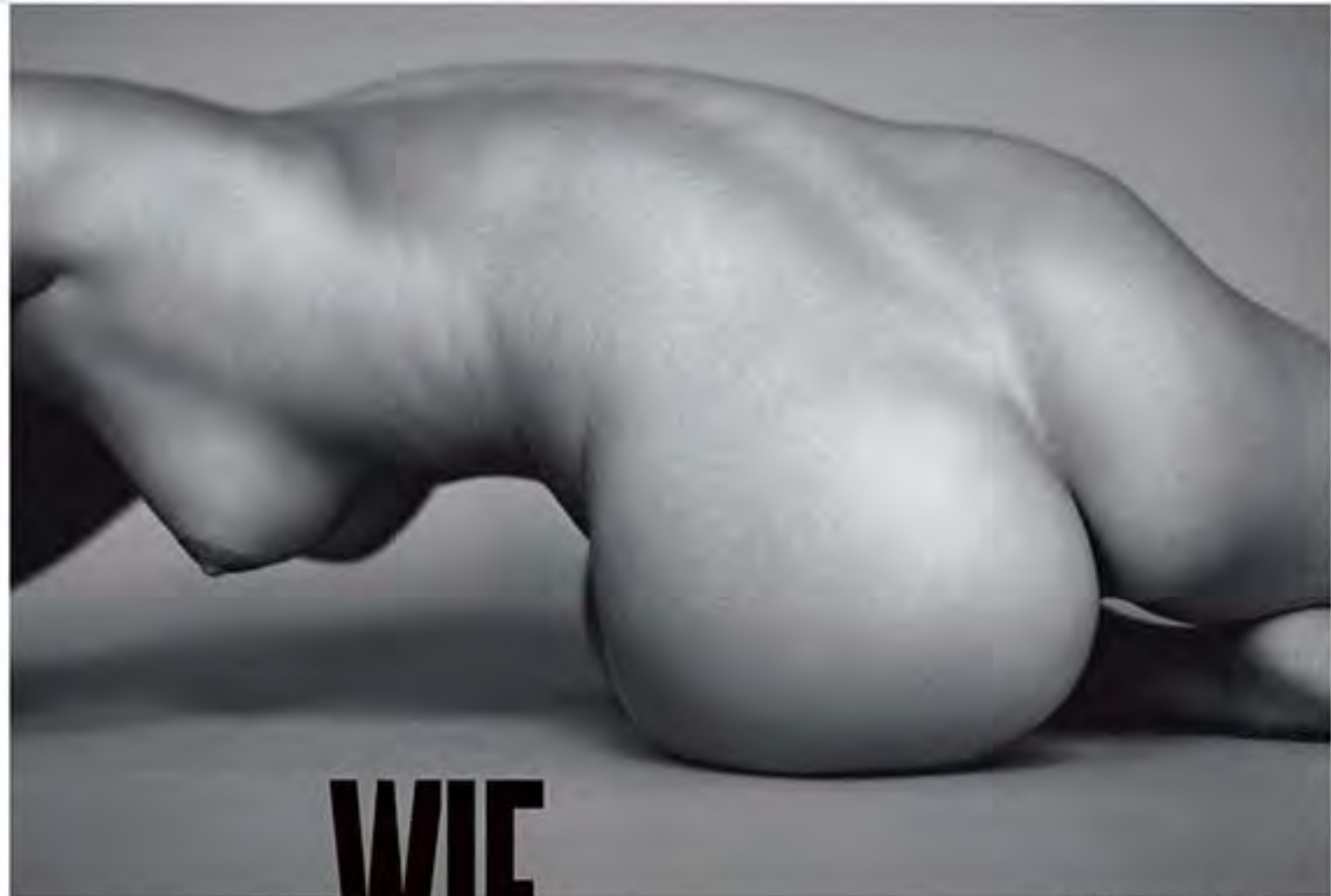
Infinite Possibilities, Marc Lagrange.