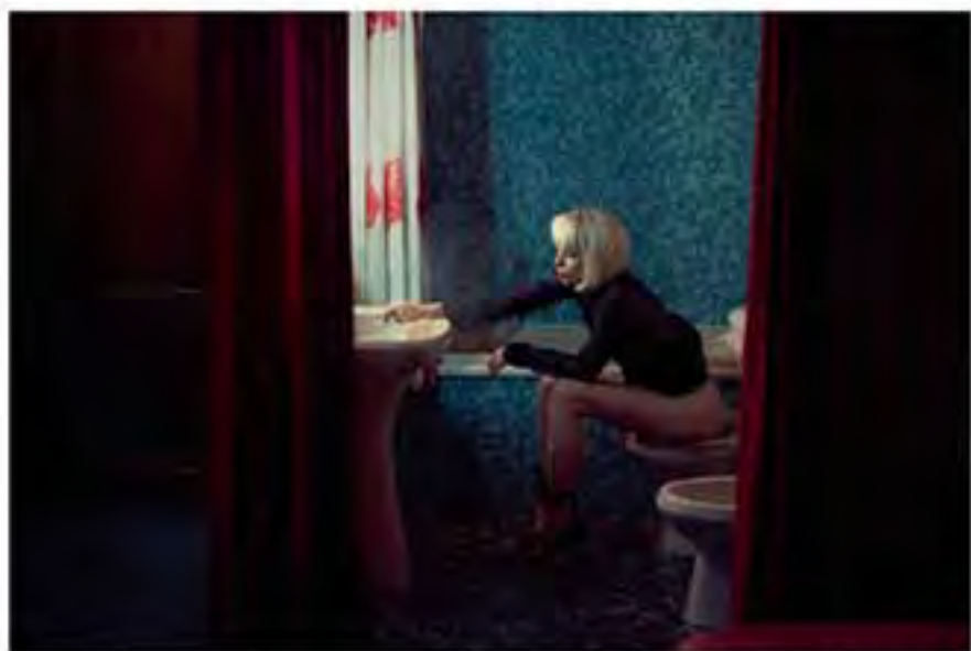
Flair de Pivé, 2015, Marc Lagrange.